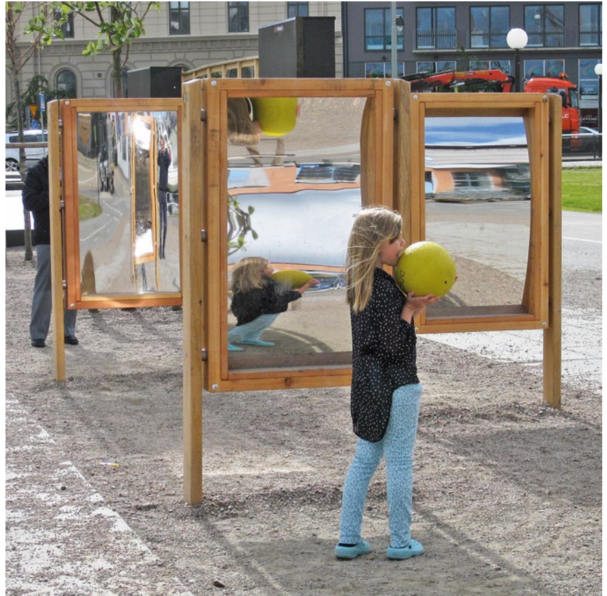
Best.-Nr. 9.10600 Zerrspiegel