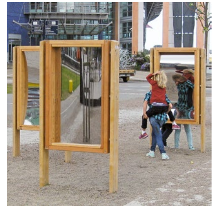
Best.-Nr. 9.10600 Zerrspiegel