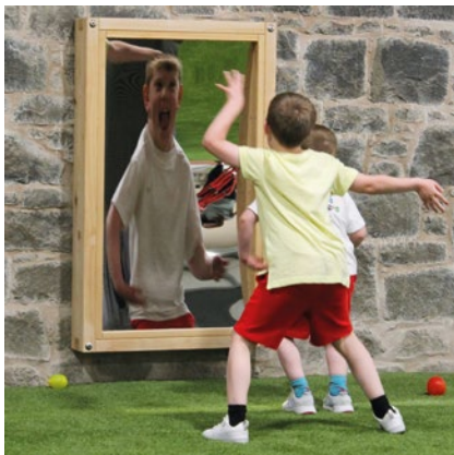
Best.-Nr. 9.10500 Zerrspiegel zur Wandbefestigung