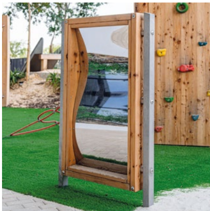
Best.-Nr. 9.10702 Zerrspiegel