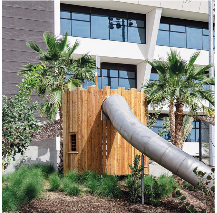
Sonderausführung mit Rutsche