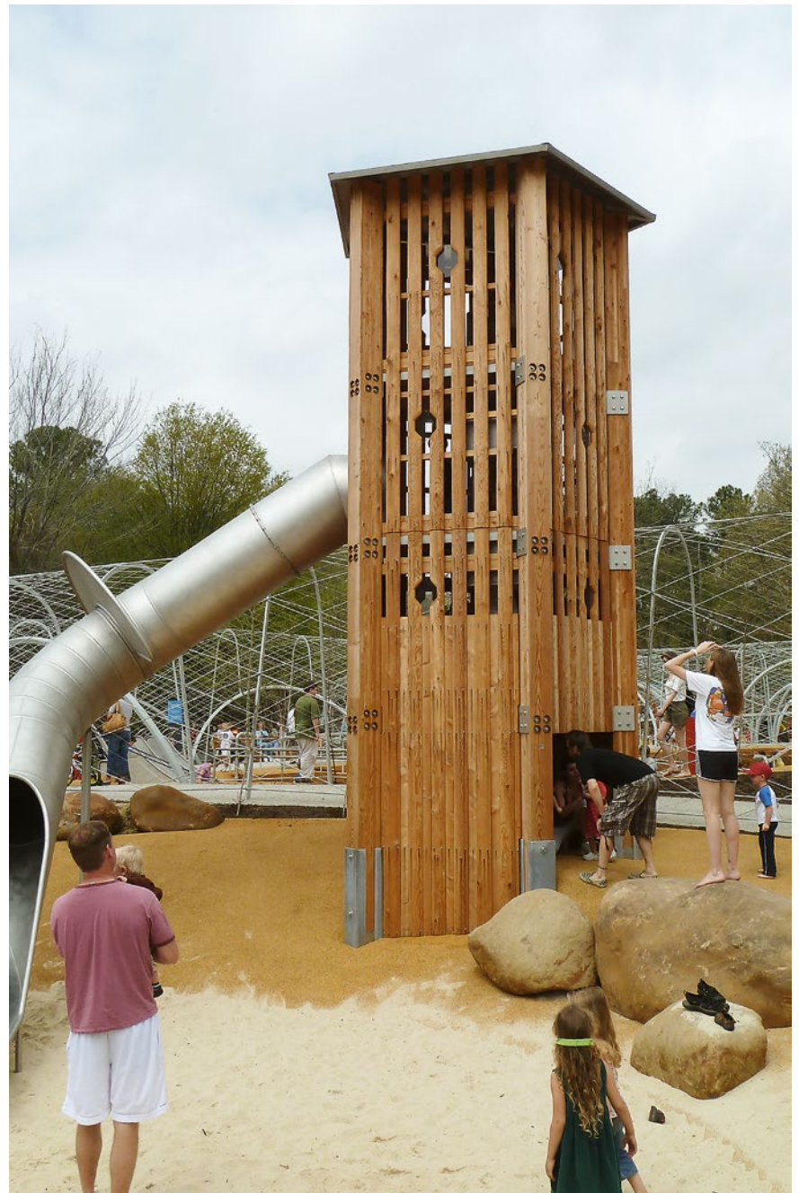
Dieses Foto zeigt den Mittleren Fünfeckturm geschlossen bis 2,40 m Höhe als Sonderausführung.

Mittlerer Fünfeckturm Großer Fünfeckturm