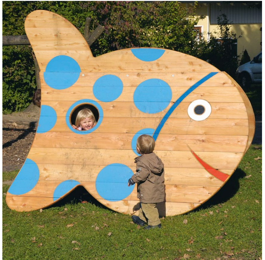
Kleiner Fisch mit Gucklöchern, Boden und Sitzbank