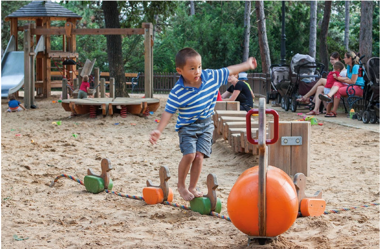
Best.-Nr. 4.24240 Entenfamilie