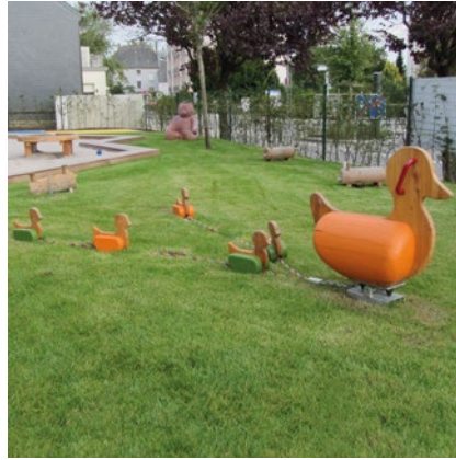
Best.-Nr. 4.24240 Entenfamilie

Die besondere Ausstrahlung der Tierfamilien trägt dazu bei, einen kindlichen Spielraum einladend zu gestalten. Das leichte Wippen macht Spaß, und die Tiere regen zu Rollenspielen an. Das spielerische Erfassen kleiner Zahlenmengen von eins bis fünf macht aus diesen Spielangeboten eine sinnvolle Ergänzung für Kleinkindbereiche.