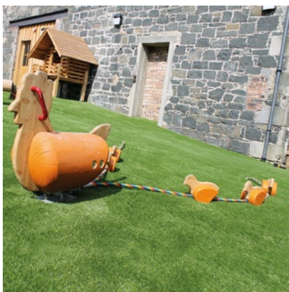
Best.-Nr. 4.24260 Hühnerfamilie