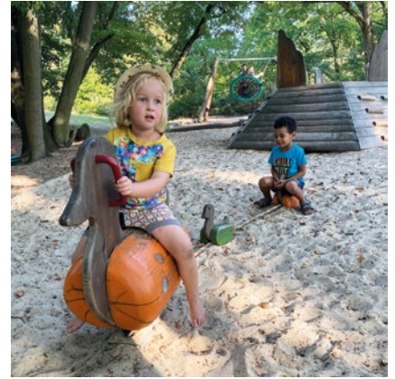
Best.-Nr. 4.24240 Entenfamilie