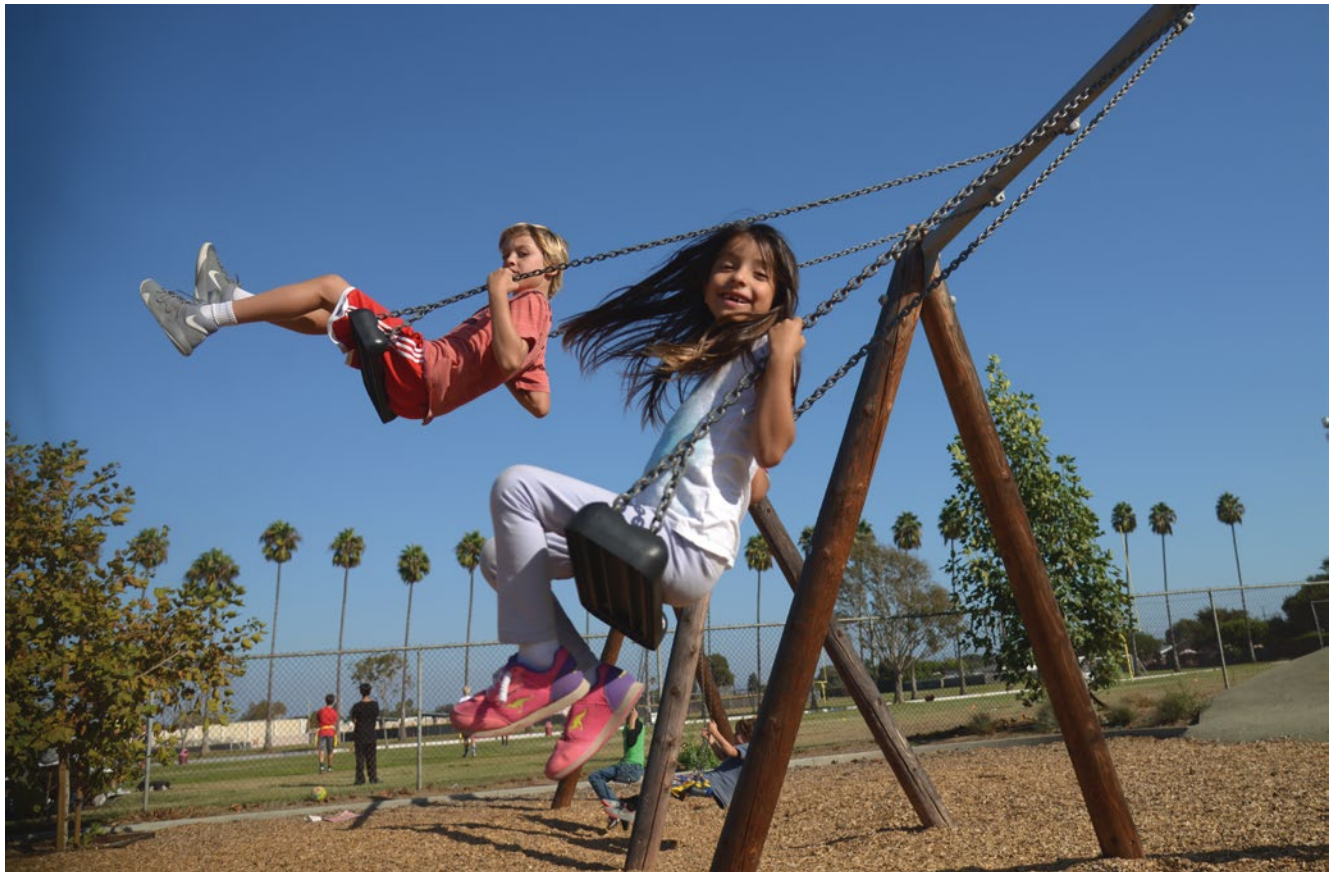
Best.-Nr. 6.14020 Hohe Zweifachschaukel spezial, Foto © Daniel Perales