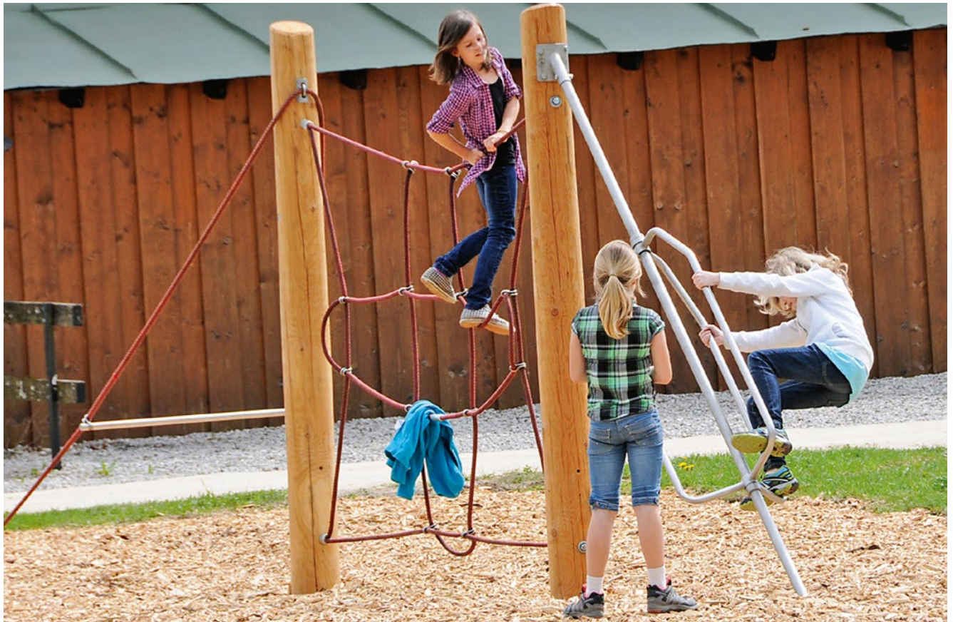
Best.-Nr. L6.46000 Kombination aus Quirl, Seilreck und Senkrechtem Kletternetz. Seilreck technisch geändert.