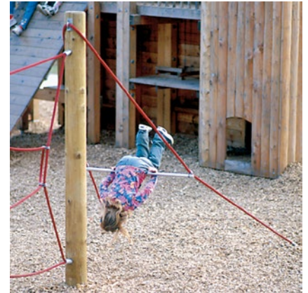
Best.-Nr. 6.45100 Seilreck