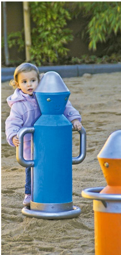
Best.-Nr. 6.28100 Drehmännchen mit Armen, hellblau / blau