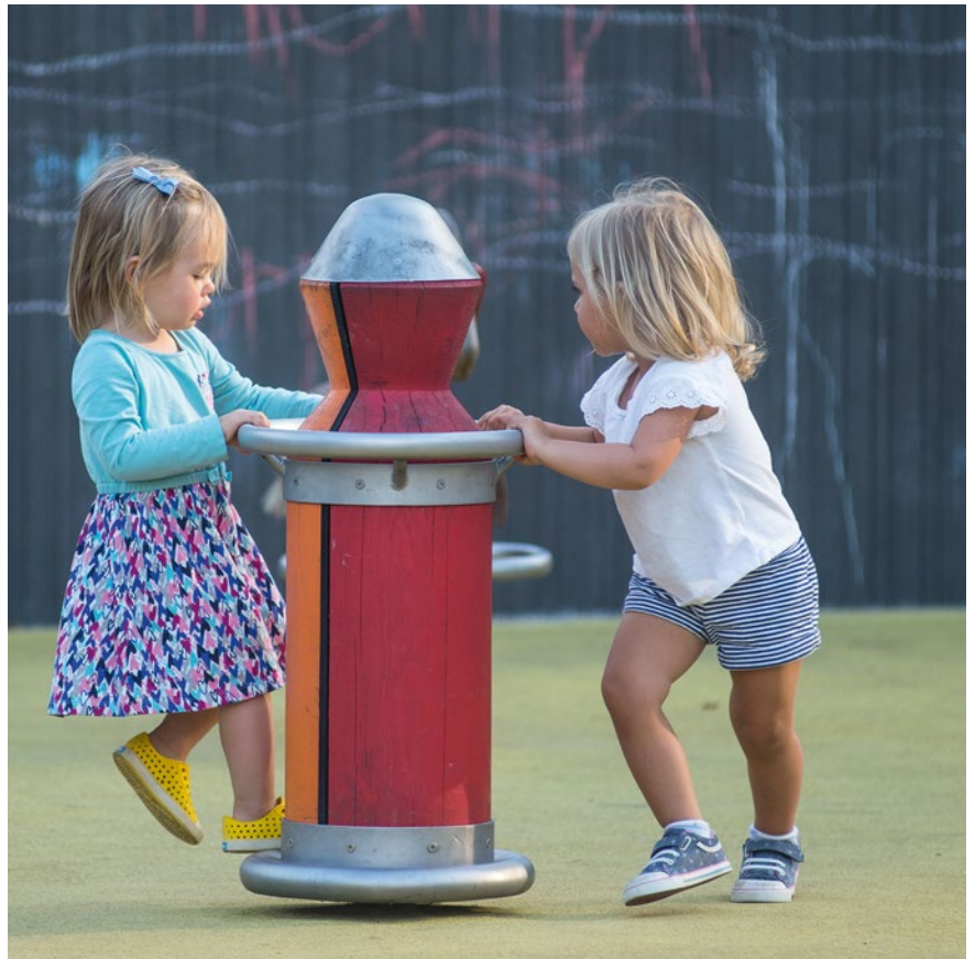
Best.-Nr. 6.28104 Drehmännchen mit Kragen, rot / orange, Foto © Daniel Perales