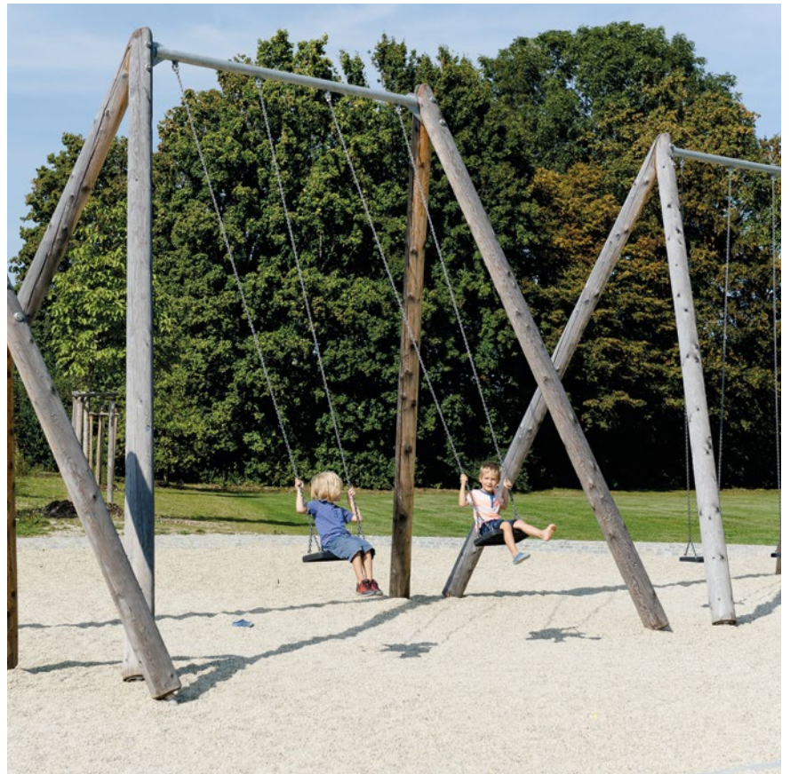
Best.-Nr. 7.14020 Überhohe Zweifachschaukel spezial

Überhohe Zweifachschaukel spezial Überhohe Einfachschaukel spezial