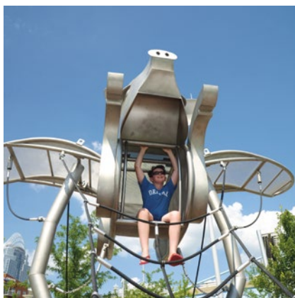
Sonderausführung, Foto © Daniel Perales