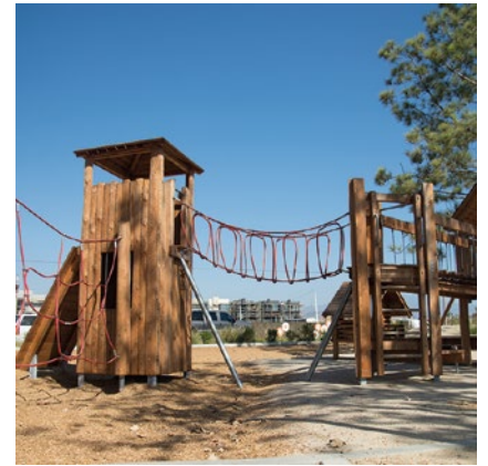
Best.-Nr. L3.20600 Viereckturm mit Dach