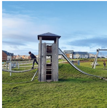
Best.-Nr. L3.20600 Viereckturm mit Dach

Die Schwarten der Turmwände werden von Hand weißgeschält und behalten dadurch die natürliche Struktur des Holzes bei. So lassen sich die Äste ertasten und die Maserung bleibt sichtbar. Die Spielräume unserer Türme sind auch ein „Häuschen“-Angebot und entsprechen in ihrer Größe dem kindlichen Raumgefühl. Fest installierte Zwischenböden bilden heimelige Räume, zum Teil mit Durchschlupf. Eine Sitzbank im unteren Raum lädt dazu ein, sich zu treffen und miteinander zu plaudern. Kinder fühlen sich darin geborgen und geschützt. Spannend wird es aber auch, wenn man im Turm in das nächste Stockwerk hinaufklettert. Die Anbaumöglichkeiten verschiedener Kombinationselemente wie Rutsche, Hängebrücke, Kettensteg usw. machen den Turm besonders attraktiv.