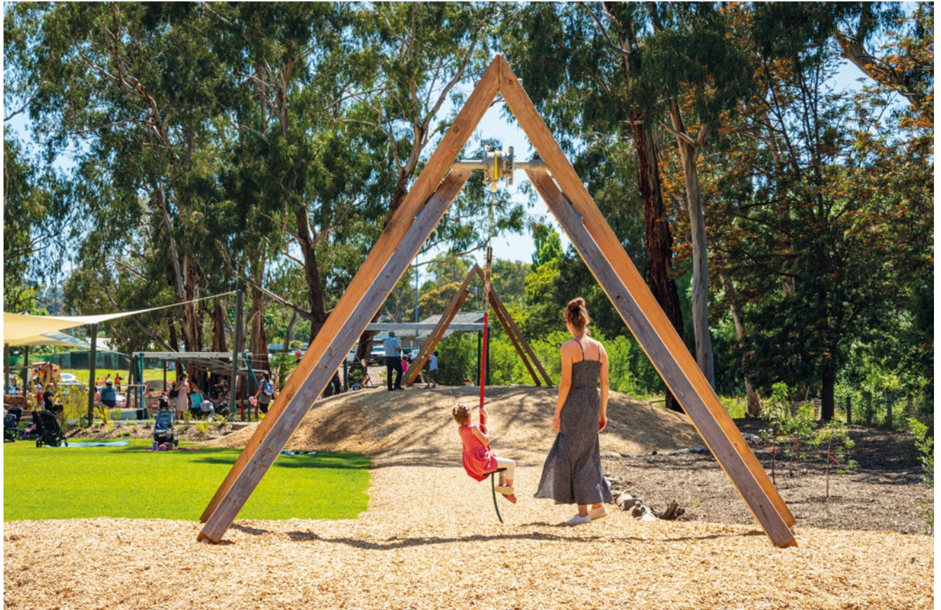
Sonderausführung mit Kantholz