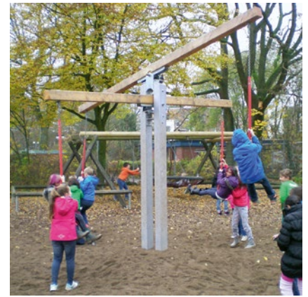
Best.-Nr. 6.10101 Kreuzwaage mit Standgestell aus V2A

Die Kreuzwaage ist eine hochgelegte Wippe mit hängenden Sitzen. Das Auf und Ab kann leicht beschwingt geschehen oder auch mit voller Kraft. Ein harter Stoß wird dabei durch eine mechanische Federung gedämpft. Auf den lang herabhängenden Pendelsitzen kann man quer schwingen und sogar ein bisschen kreisen. Die Kreuzwaage fördert Kommunikation und Kooperation.