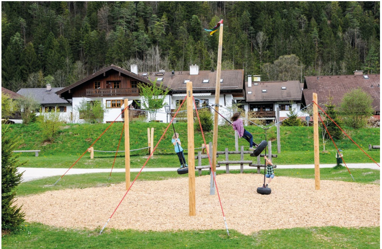
Das Foto zeigt abweichende Abspannseile.

Tragen die Mastspitzen dazu noch Mobiles und Windfiguren, so wird die Bewegung in luftige Höhe übertragen und allein schon das Zuschauen macht Freude.