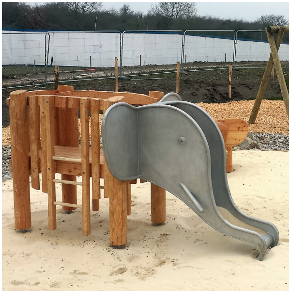
Elefant mit Rüsselrutsche Sonderausführung 100 cm

Vielen Dank für einen Veröffentlichungsbeleg.