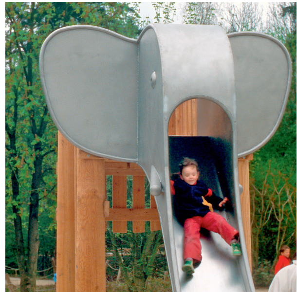
Elefant mit Rüsselrutsche