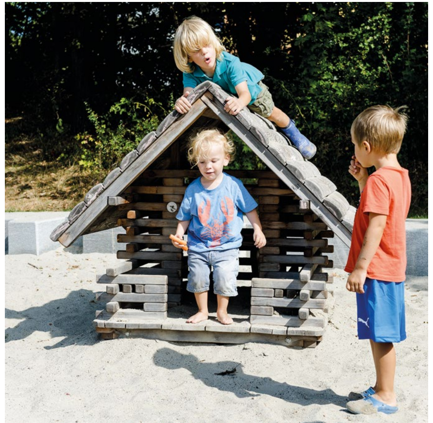
Grere Huser identischer Bauart siehe Katalog „Kind und Spiel“